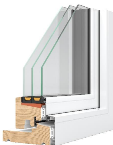
Figur 4: Nor360