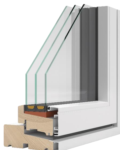
Figur 2: Nor1 træ/alu