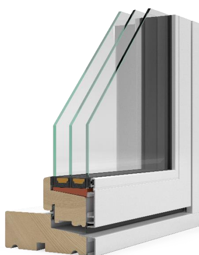
Figur 3: Nor48