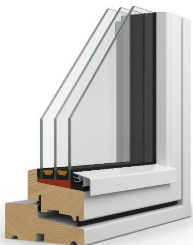
Figur 1: Nor1 træ