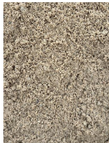
0-4 mm Bundsikringsgrus kv. II