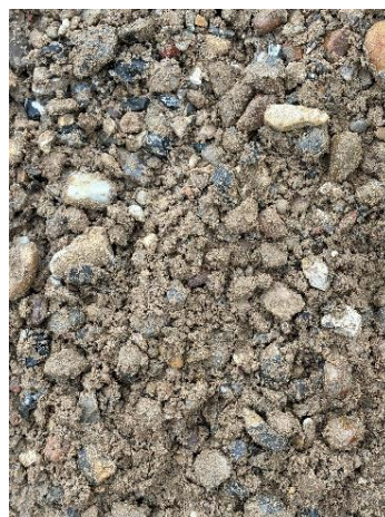
0-32 mm stabilgrus kv. II