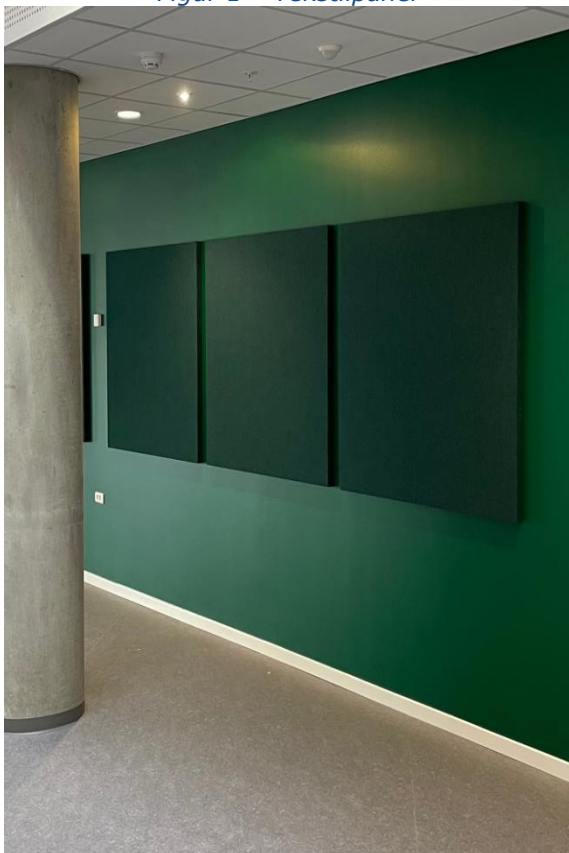
Figur 1 - Tekstilpanel