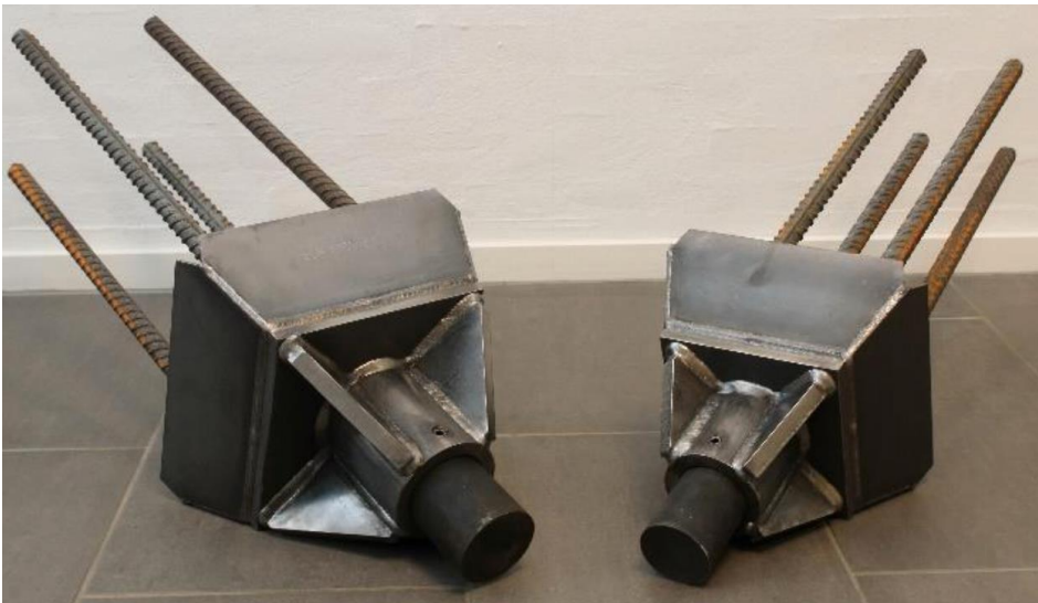
Foto af produkt

Levetiden er den samme som funderingspælene, hvor koblinger monteres. Levetiden regnes derfor som 100 år (RSL) jf. Annex AA i "DS/EN 16757:2017 – "Bæredygtighed inden for byggeri og anlæg – miljøvaredeklarationer – Produktkategoriregler for beton og betonelementer".